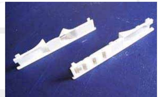
Foto links: Die Höhe des eingepassten Seitenteils beträgt 27mm, gemessen im Bereich der senkrechten Karosseriesicke (vgl. Pfeil)